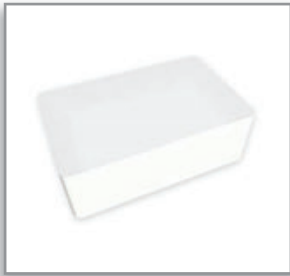
Tarjetas PVC Mifare 4 Kb Blancas

Tarjetas de proximidad Mifare Blancas, 1 Kb, ISO 14443 A, chip original Mifare Philips NXP, calidad gráfica para impresión directa, CR80. Caja con 50 tarjetas.