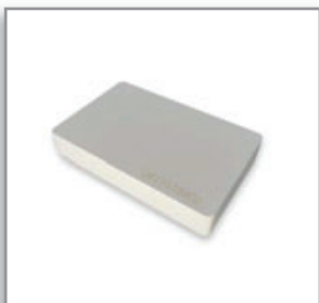
Tarjetas PVC Mifare 1 Kb Blancas CSN impreso

Tarjetas de proximidad Mifare Blancas, 4 Kb, ISO 14443 A, chip original Mifare Philips NXP, calidad gráfica para impresión directa, CR80. Caja con 50 tarjetas.