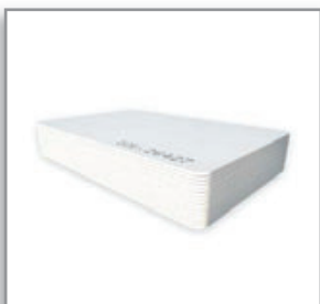
Tarjetas PVC 125 kHz EM Blancas

Tarjetas de proximidad Mifare Blancas, 1 Kb, acabado glossy, 100% PVC, tamaño CR80 (tarjeta de crédito) con CSN (Número Serial de Tarjeta) impreso con láser. Caja con 50 tarjetas.