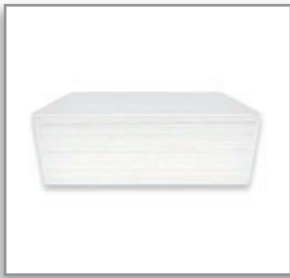
Tarjetas PVC Mifare 1 Kb Blancas